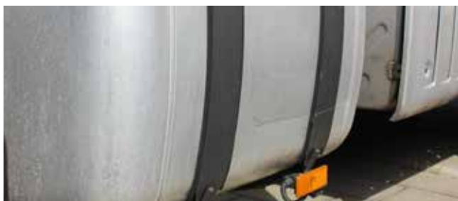
✓ Brandstoftank/Teken van slijtage • Krassen