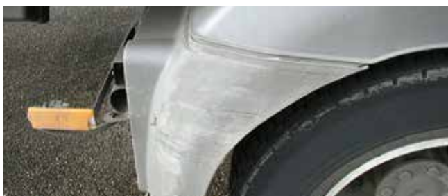
✓ Spatbord/Teken van slijtage • Lichte krassen op het oppervlak