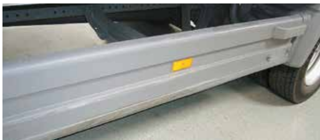
✓ Onderrijbeveiliging/Teken van slijtage • Lichte slijtage