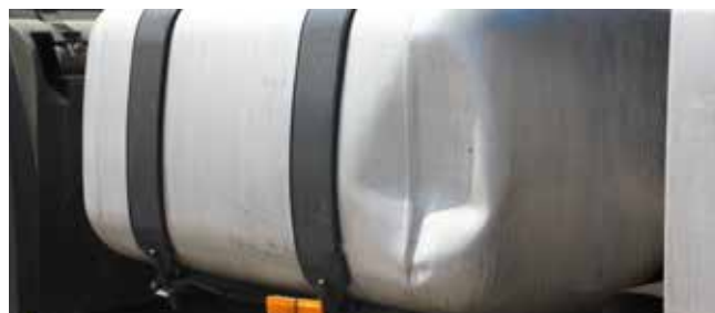
✗ Brandstoftank/ Substantiële schade • Vervorming