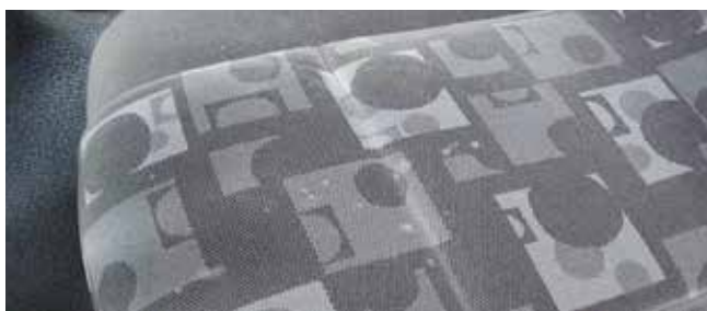
✓ Stoelen/Teken van slijtage • Vlekken