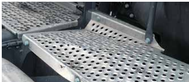
✗ Frameafdekking/ Substantiële schade • Grote vervorming