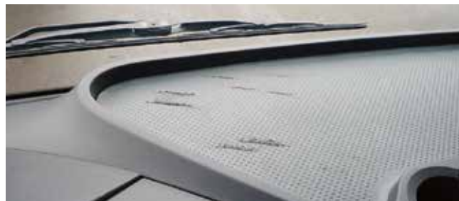
✗ Dashboard/Substantiële schade • Diepe krassen, gaten of geboorde gaten