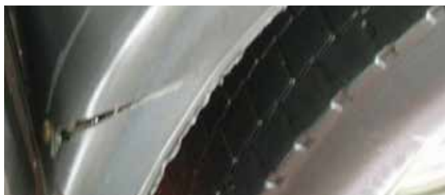
✗ Spatbord/ Substantiële schade • Krassen, barsten of materiaalbreuk