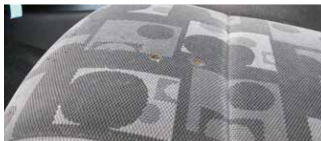
✗ Stoelen/ Substantiële schade • Gaten of scheuren