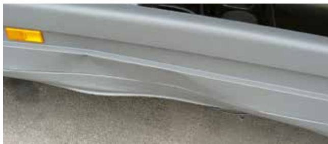
✗ Onderrijbeveiliging/ Substantiële beschadiging • Grote vervorming